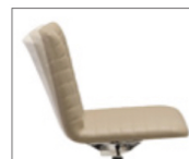
Option dossier inclinable