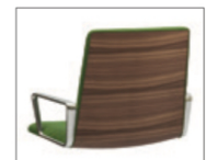
Option dossier bois