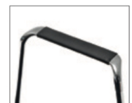
Option accoudoirs tapissés (SO 1860)