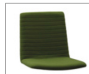
Option coutures horizontales